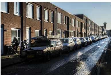
Straat in de Korrewegwijk.